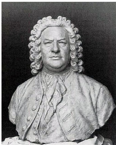
19e-eeuws borstbeeld van J.S. Bach

De volgende aria bestaat eigenlijk uit twee duetten die tegelijkertijd klinken. Het resultaat is een zeer knap en fraai samenspel. Boven de vier stemmen van het slotkoraal spelen de eerste violen een extra bovenstem, om het eerder genoemde feestelijk karakter muzikaal te onderstrepen.